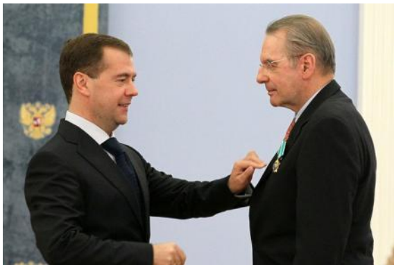
El presidente Rogge, condecorado por el presidente ruso Medvedev.