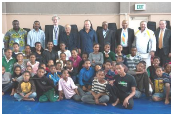
Los niños de Macassar, con la delegación de la IJF.