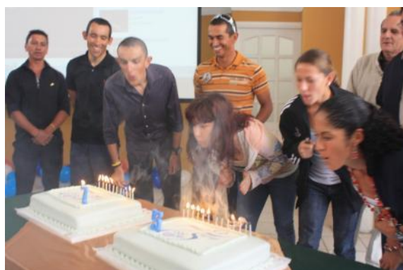
Los atletas de Pekín 2008 y Singapur 2010 soplaron las velas de los 75 años del CON de Costa Rica.

El CON canadiense ha anunciado la creación de un programa de reconocimiento a la labor de los entrenadores. El programa, que ofrecerá recompensas económicas a los entrenadores de los atletas que consigan medallas olímpicas, se enmarca dentro de un nuevo plan general del CON, que intenta dar mayor relieve a la labor a los entrenadores. El plan contempla además un grupo de trabajo integrado por entrenadores, cuyo objetivo será reconocer mejor la labor de los entrenadores y resaltar su misión; un programa de reconocimiento para los entrenadores de atletas que ganen medallas olímpicas y panamericanas en disciplinas reconocidas por el CON, y un último programa de reconocimiento, que se pondrá en práctica el año próximo en Londres. El comunicado completo, en www.olympic.ca