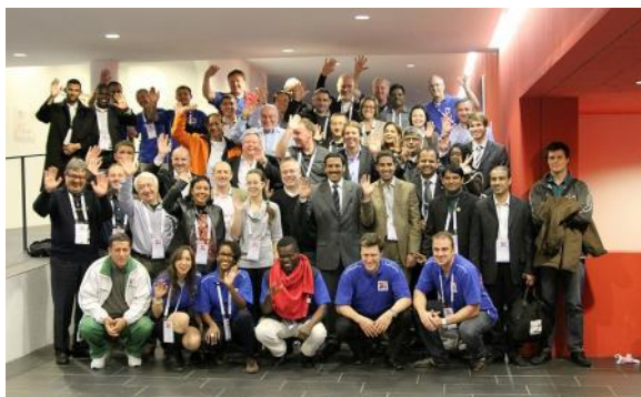
Los participantes en el seminario de la FITA.

Del 18 al 20 de noviembre pasado, en Lausana, la Federación Internacional de Tiro con Arco (FITA) celebró su primer seminario de gestión, en el marco del Plan Mundial del Tiro con Arco 2007-2012. Con la participación de medio centenar de personas procedentes de 30 países, el seminario tenía por objetivo reforzar los lazos entre las asociaciones miembros, mediante el intercambio de experiencias positivas y de proyectos concretos trasladables a otros países, con miras a aumentar la eficacia en la gestión de las asociaciones afiliadas. Otras organizaciones deportivas, entre ellas Solidaridad Olímpica, la Federación Internacional de Hockey (FIH) y la Federación Mundial de Taekwondo (WTF) también hicieron presentaciones en el seminario, que marca el punto de partida del Plan Mundial del Tiro con Arco 2012-2017. El comunicado se puede leer en www.archery.org